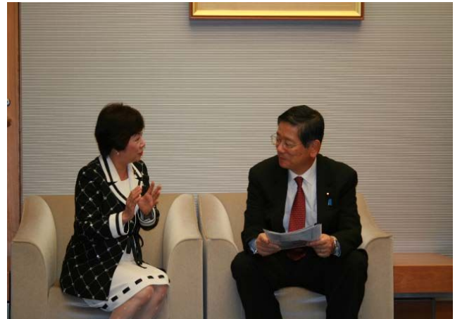
町村官房長官に診療報酬改定について説明