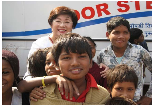
参議院インド・ネパール視察