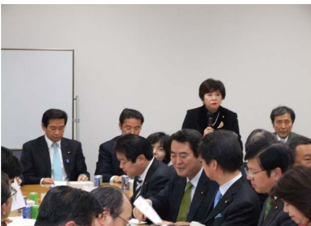
国民歯科問題議員連盟の設立総会